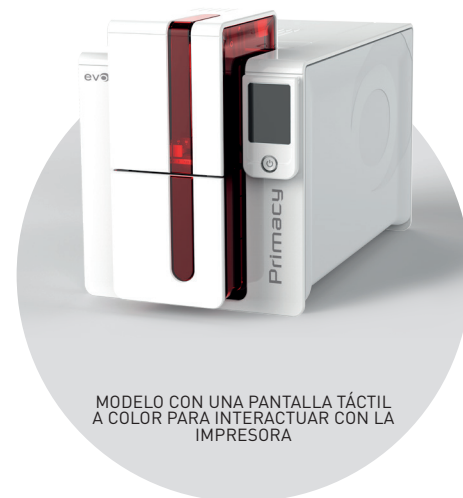
MODELO CON UNA PANTALLA TÁCTIL A COLOR PARA INTERACTUAR CON LA IMPRESORA