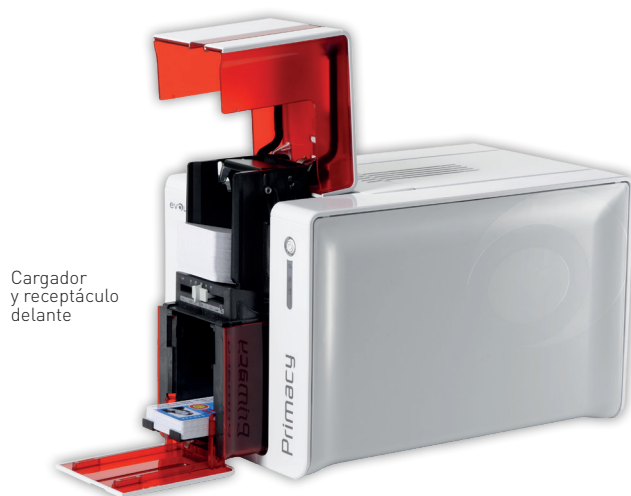
Cargador y receptáculo delante